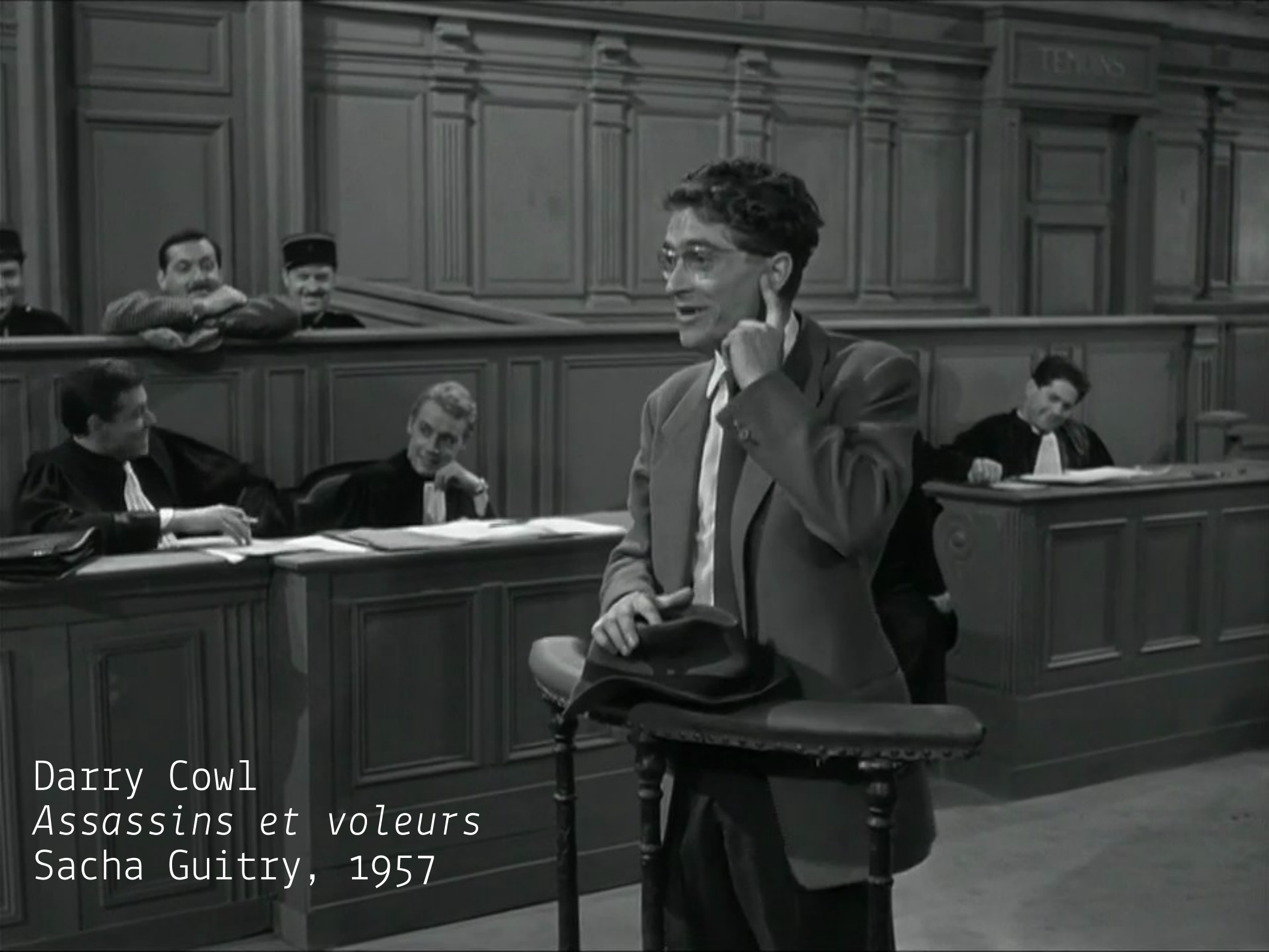
Darry Cowl Assassins et voleurs Sacha Guitry, 1957