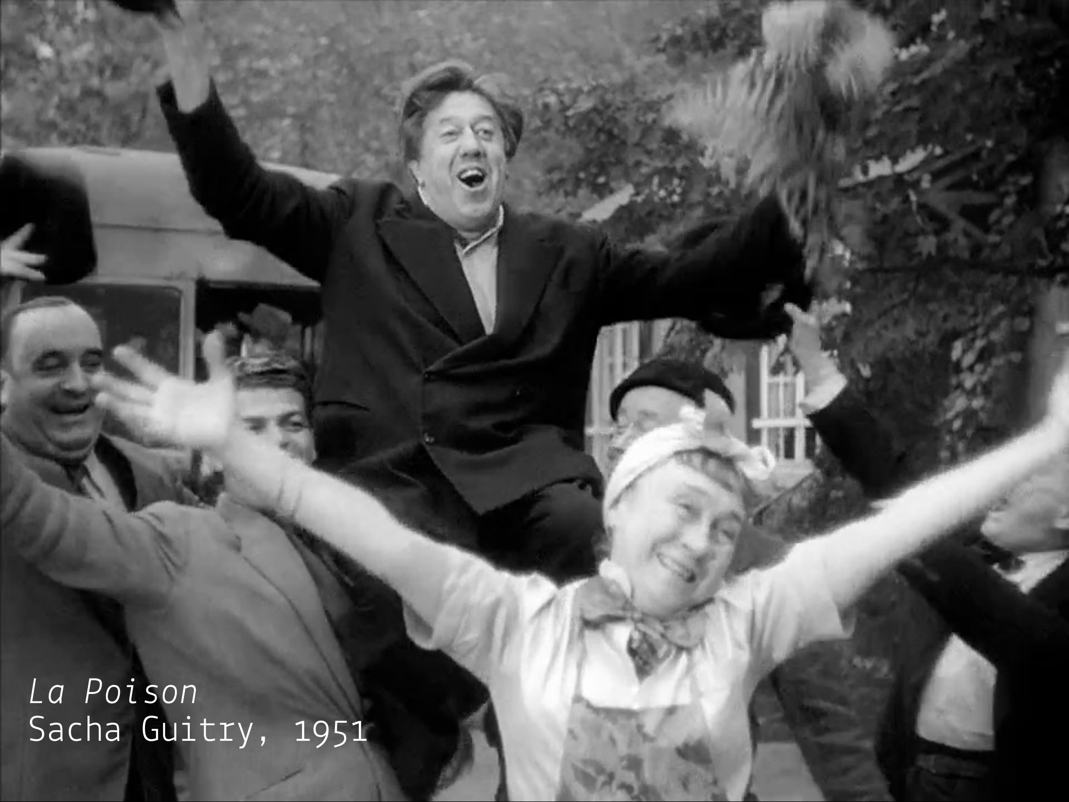
La Poisson Sacha Guitry, 1951