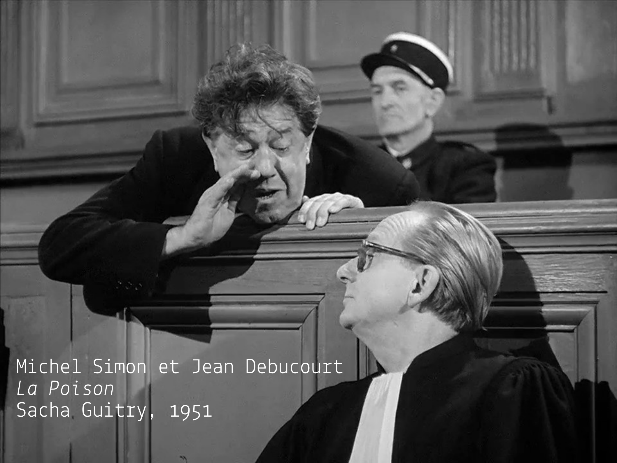
Michel Simon et Jean Debucourt La Poison Sacha Guitry, 1951