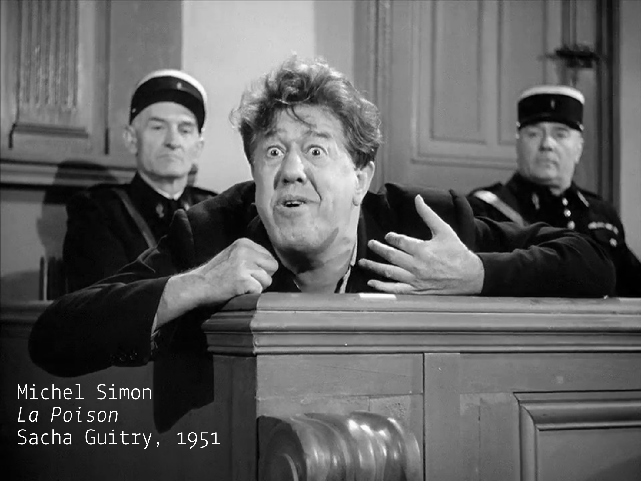
Michel Simon La Poison Sacha Guitry, 1951